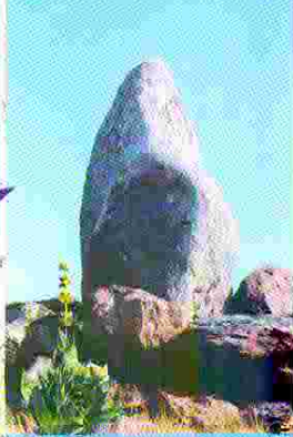
à côté d'un buron